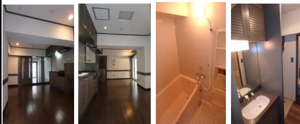
↑ Aタイプ(201号室)の写真です ↑