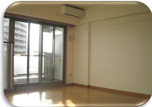
11. 2畳のフローリング