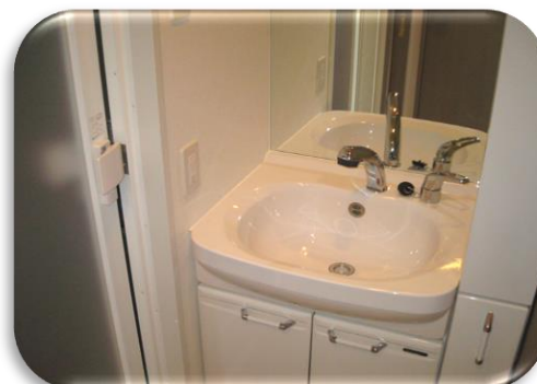
洗髪洗面化粧台付の快適生活