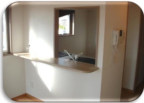
1Hコンロのカウンターキッチン