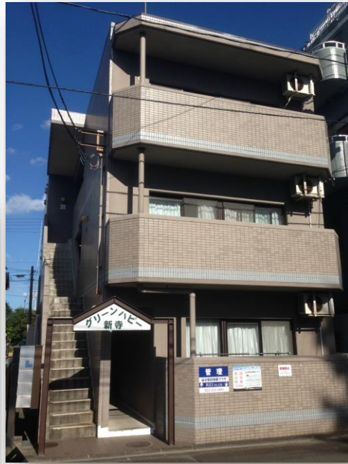
資料と現況が異なる場合、現況が優先となります。