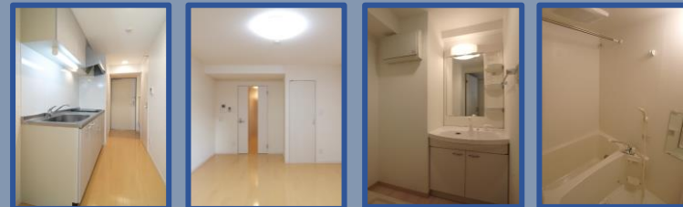
※「Cタイプ」の室内写真となります